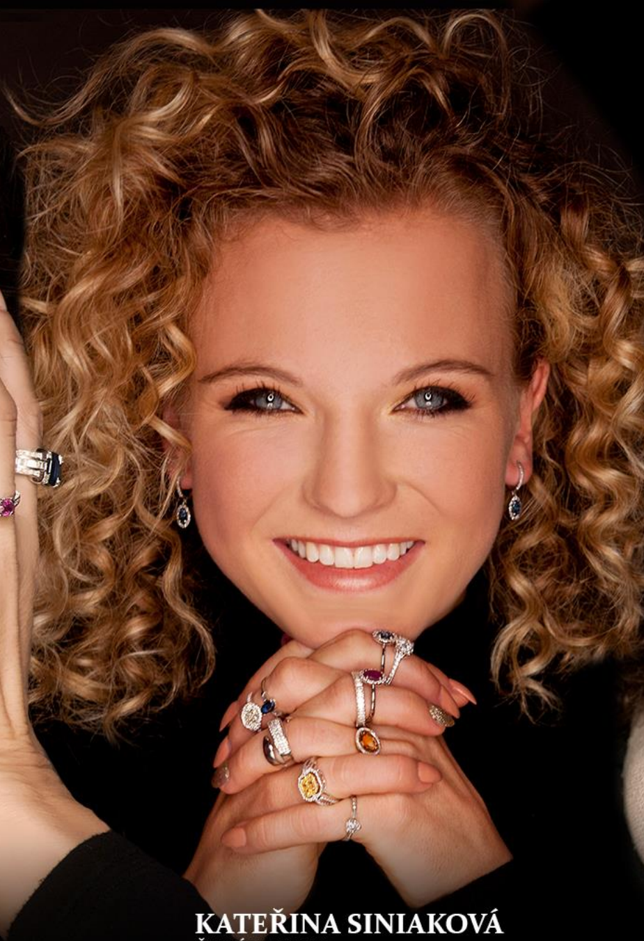
KATEŘINA SINIAKOVÁ ČESKÁ TENISTKA